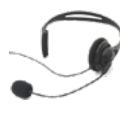
ヘッドセットマイク HEM-20