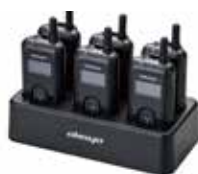
6 ポケット充電器 C6

充電器や腕用ポーチ、様々なタイプのヘッドセットをご用意しております。 ※別途ご相談ください。